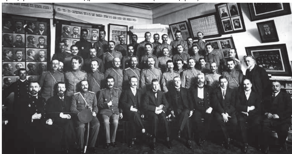
Профессор-криминалист Р.А. Рейсс и офицеры Александровской Военно-Юридической Академии

но-Юридической Академии. Самостоятельный курс учебной дисциплины «Криминалистика» в ВЮА начал преподавать выдающийся русский криминалист, автор учебников, профессор С.Н. Трегубов (1866-1945), работавший одновременно директором департамента Министерства юстиции России. На практических занятиях слушатели Академии привлекались к проведению судебных экспертиз. В 1913 г. с лекциями в Академии выступил выдающийся профессор-криминалист Р.А. Рейсс (Швейцария).