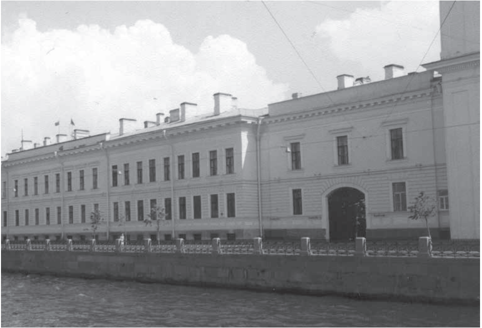
Здание Александровской Военно-Юридической Академии