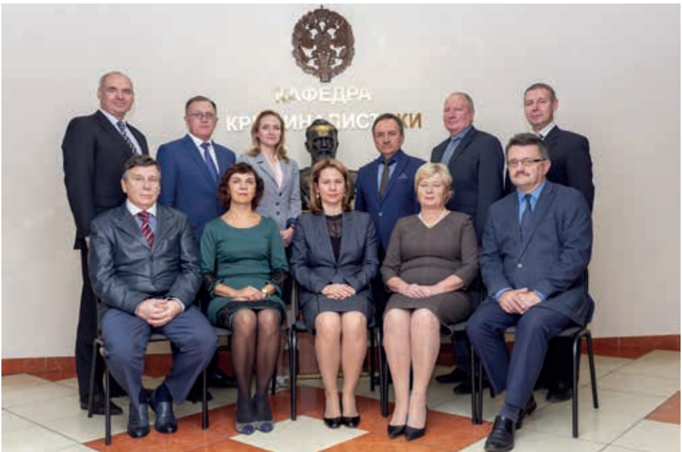
Кафедра Криминалистики Военного университета Министерства обороны Российской Федерации (2019 г.)